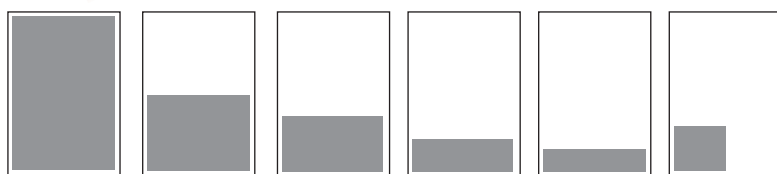
PAGE 120 X 280

LIEN CLIQUABLE AVEC VOTRE WEB, VOTRE MAIL OU VOTRE TÉLÉPHONE